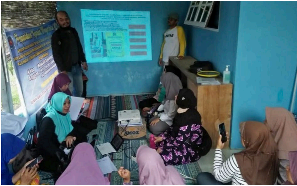
Gambar 1. Pelatihan PKM Kepada Masyarakat Di Desa Kota Pari