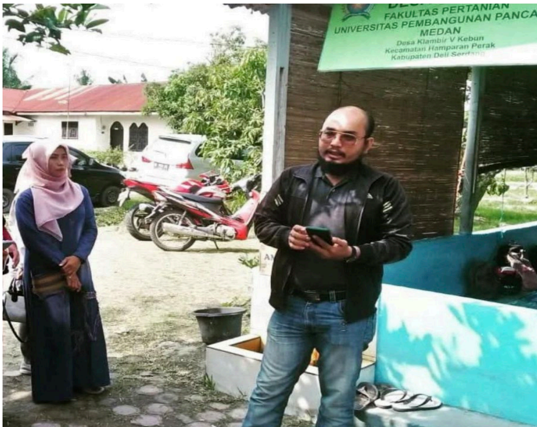
Gamar 2. Kegiatan Workshop