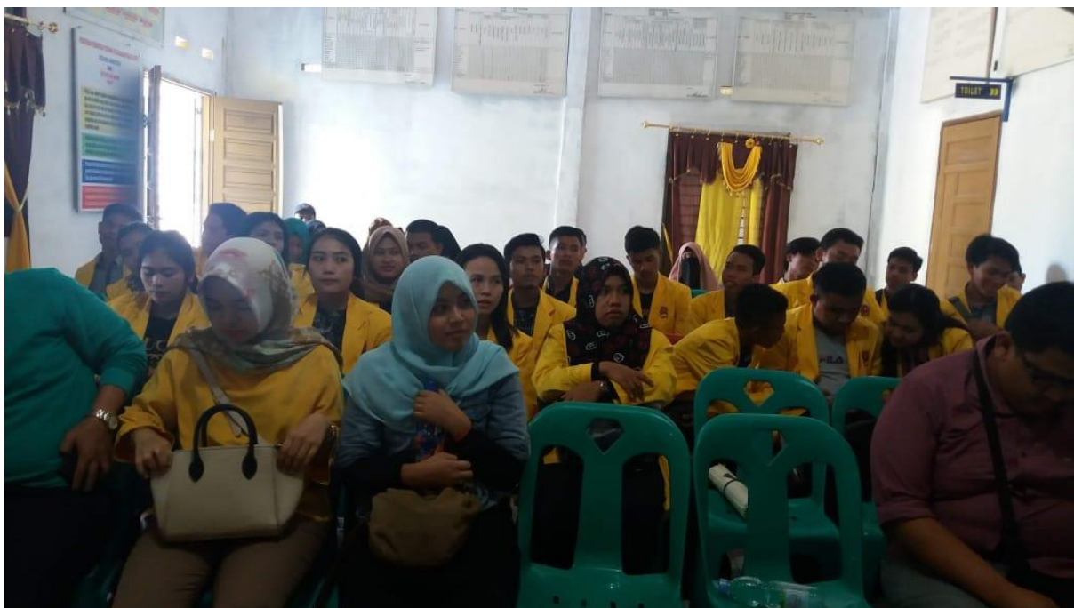
Gambar 2. Foto pelaksanaan PKM