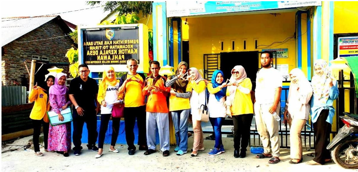
Gambar 1. Tim yang di bantu oleh beberapa orang mahasiswa

pelaksanaan program PKM yang tidak lupa melibatkan mahasiswa Universitas Pembangunan Panca Budi sebagai tim sukses dilapangan.