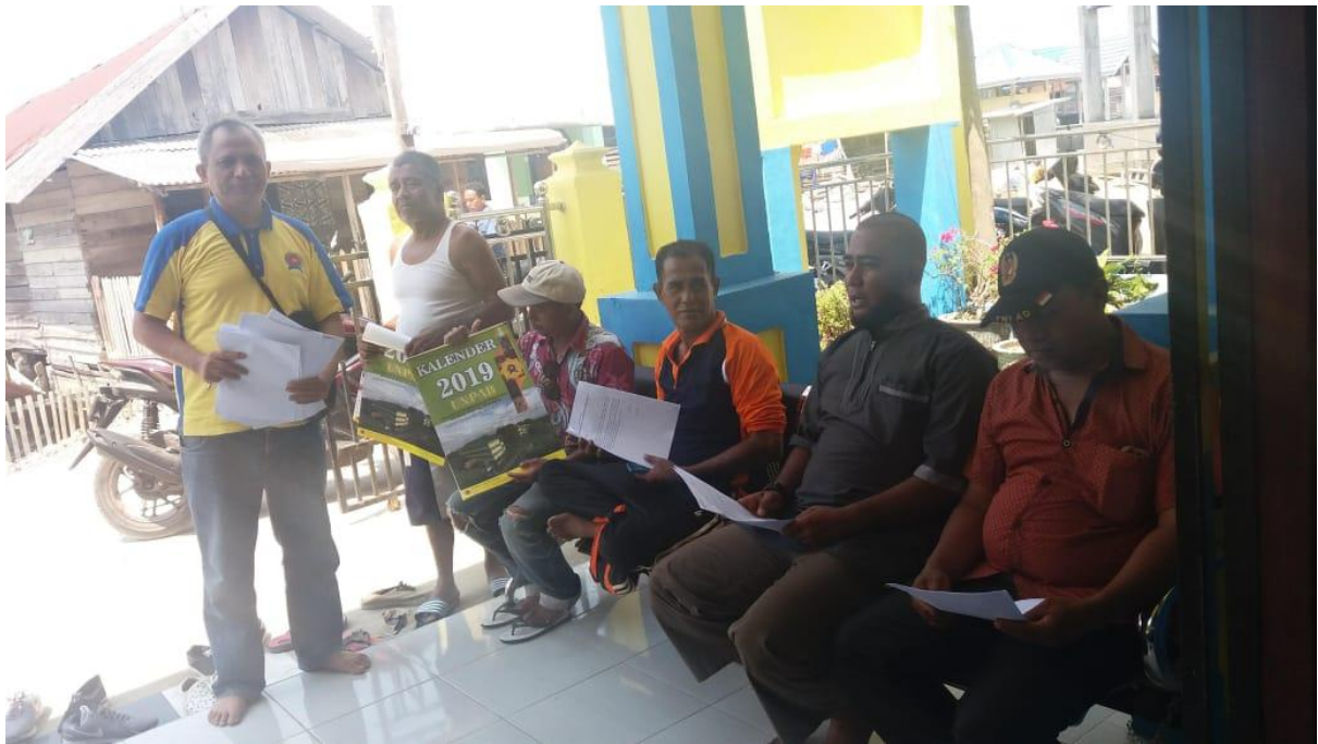
Gambar 3. Kegiatan Pelaksanaan PKM