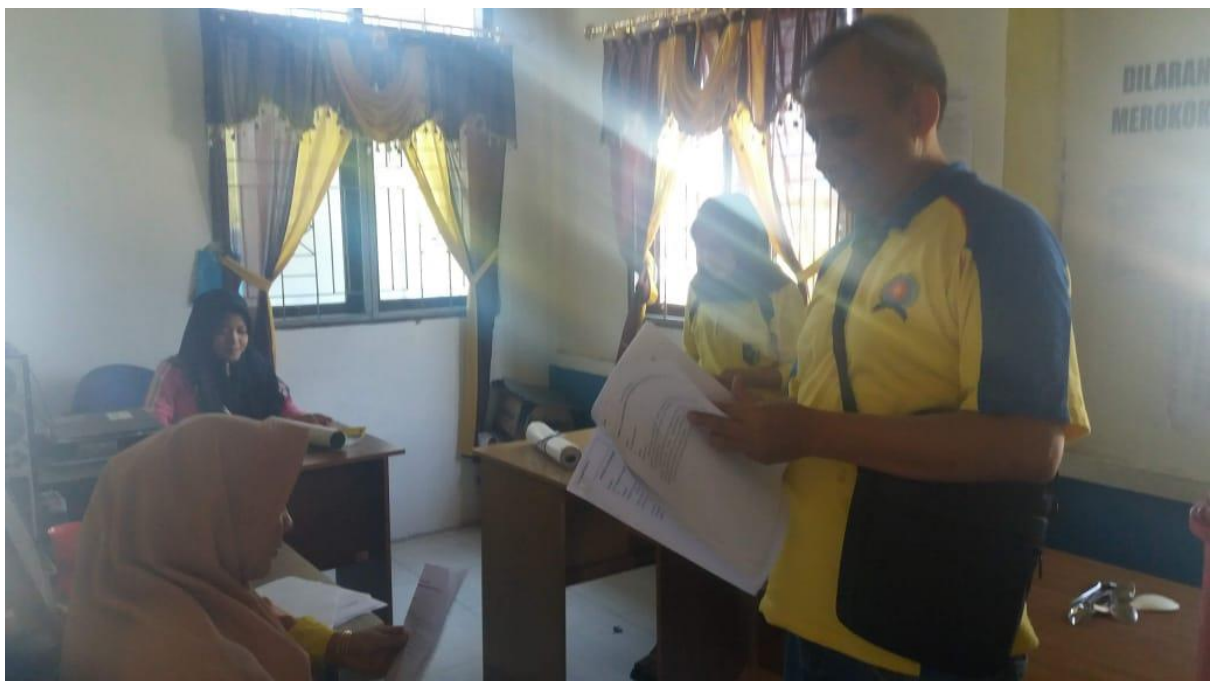
Gambar 4. Foto Pelaksanaan PKM